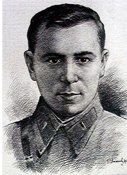
Džalil im Krieg

Ende 1954 wurden die Moabiter Hefte zum ersten Mal komplett auf Russisch herausgegeben, und beim 2. Unionskongress des sowjetischen Schriftstellerverbandes vom 15. bis 26. Dezember 1954 erwähnte der Vorsitzende A. Surkov den tatarischen Schriftsteller in seinem Vortrag. 1955 wurden drei Bücher von Džalil' auf Russisch publiziert, Die ausgewählten Werke , Aus den Moabiter Heften und Ein Heldenlied . In Tatarstan wurden anschließend Denkmäler zu Ehren des Autors errichtet und Straßen nach ihm umbenannt. Diese Aktionen gingen auf die Initiative der tatarischen Parteiführung zurück, deren Gebietskomitee Anfang 1956 „den Redaktionen der Zeitungen auf Republik- und Bezirksebene [vorschlug], die Heldentat und Musa Džalil's Werk breiter zu propagieren.“ 13